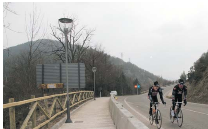
Auto, txirrindulari eta oinezkoek 100 metro baino gehiagoko zati bat konpartitzen dute.

Arre/Atarrabian zehar, errepidea NA-2517a errepidea arriskugarria zen oinezkoentzat ia kilometro batean zehar. Zati horretan kamioiek, txirrindulariek, oinezkoek eta autoek espaloia eta bazterbidea konpartitzen zituzten ia seinalerik gabe eta beren artean bereizketarik gabe. Mugimendu dezenteko errepide horretan, minutuko hamar ibilgailu baino gehiago ibiltzen baita, segurtasuna lehentasunezko kontua zen. Ezkabarteko Udalak, Nafarroako Herri Lanetako Departamentuarekin elkarlanean, zatiaren arriskugarritasuna ezabatu eta bizilagunei bi herrien artean ibiltzea errazteko plan bat abiatu zuen.