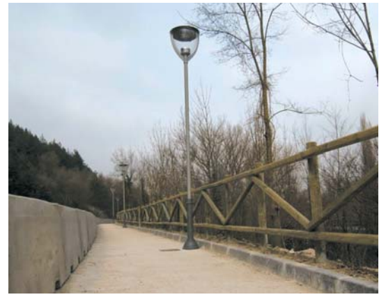
56.000 € inbertitu da pasealekuko segurtasuna handitzeko. / Jesús Chueca.

Guztira 50.000 euro baino gehiagoko aurrekontua, egun José Maríaren, Isabelen eta beste anitzen onurarako, jada Arre eta Atarrabiaren artean arriskurik gabe pasea baitaitezke.