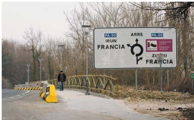
NA-2517an oinezkoentzako pasabide bat Arre eta Atarrabia artean. / Jesús Chueca.