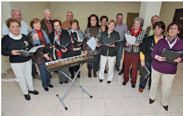
Irudietan, Ezkabarteko Abesbatzaren entsegu bati buruzko bi une ageri dira.

“Denoi kantatzea gustatzen zaigu; horrexegatik da giroa horren lasaia”