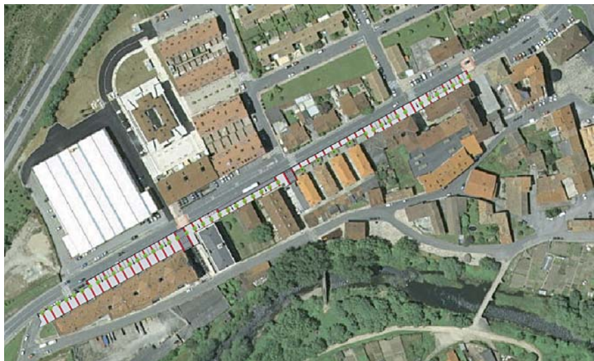
Irudian, Irungo Etorbidea hobetzeko lanek hartzen duten ingurua.

Egungo euri-uren sarea ere osatuko da galtzadetakoko hustubide berriak biltzeko eta, era berean, ura espaloira isurtzen duten eraikineta-