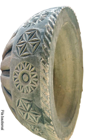
Pila bautismal Babarra